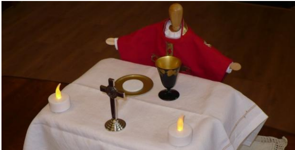
Voorbeeld van kinder catechesemateriaal De Goede Herder

"De kruisweg spreekt". Dat was de naam van één van de vele catechese-avonden die in 2015 in de Josephkerk zijn georganiseerd. Maar ook "Grote middeleeuwse theologen" kwamen tijdens de goedbezochte catechese-avonden in de Josephkerk aan bod. Aan kinderen wordt er al vele jaren de Catechese van De Goede Herder aangeboden. Ook in 2015 was dat het geval. De groep kinderen groeide in 2015 verder. Er zijn twee groepen voor verschillende leeftijdscategorieën. Meer informatie via www.cathechesegoedeherder.nl